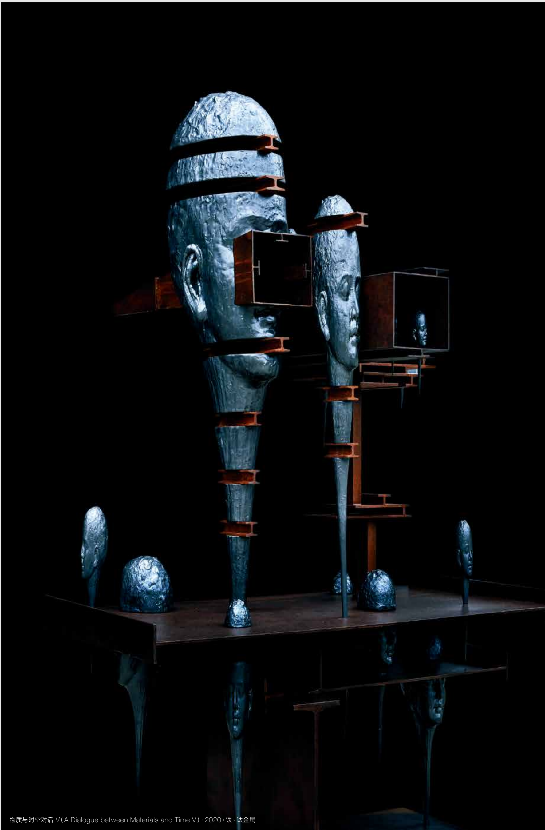
物质与时空对话 V (A Dialogue between Materials and Time V) · 2020 · 铁·钛金属