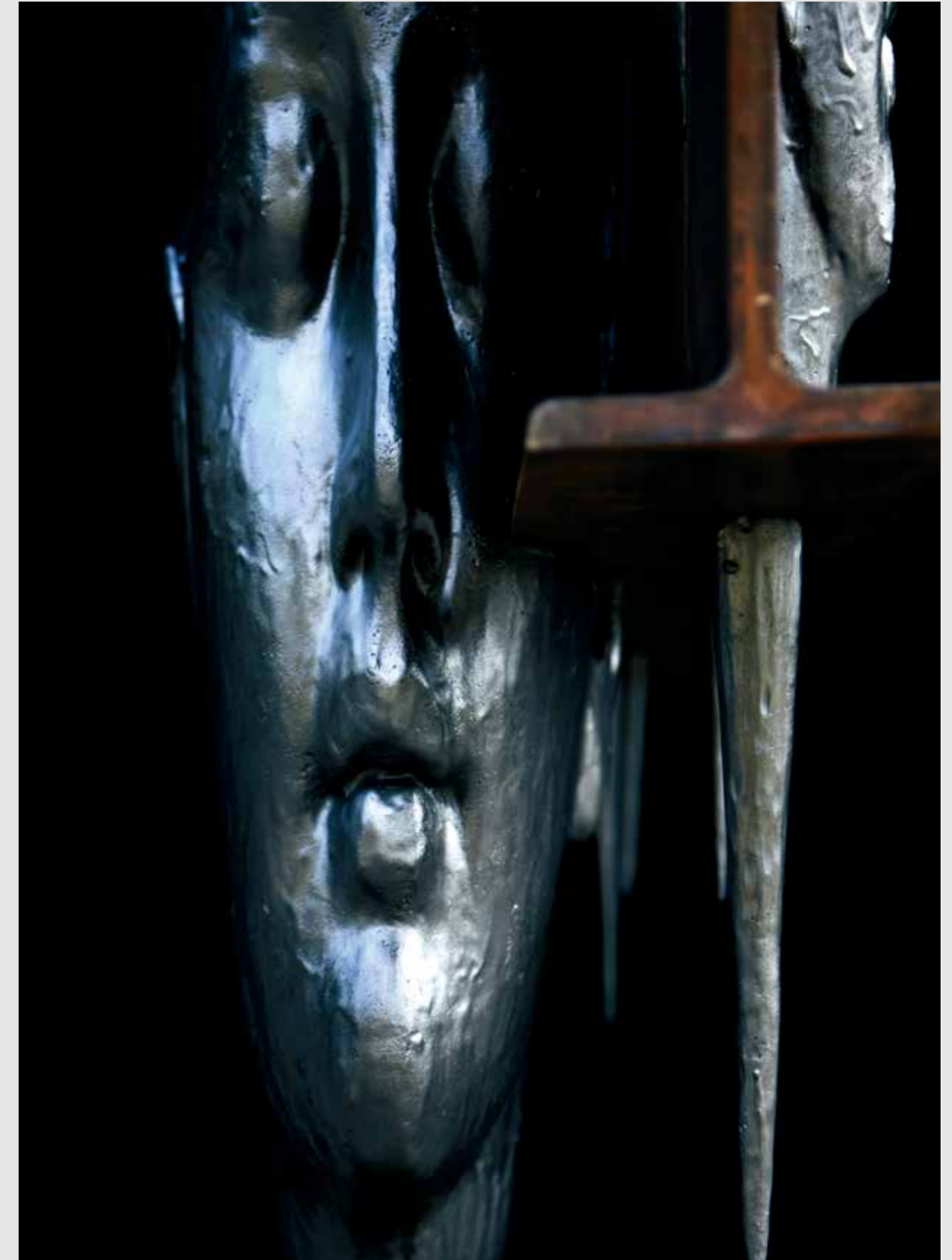
物质与时空对话 II (A Dialogue between Materials and Time II) · 2020 · 铁·钛金属

我喜欢去想象，当时间翻开新的一页，当现在成为过去， 人们将会发现我透过这些不朽的创作，所留存下的时间。 ——陈世英