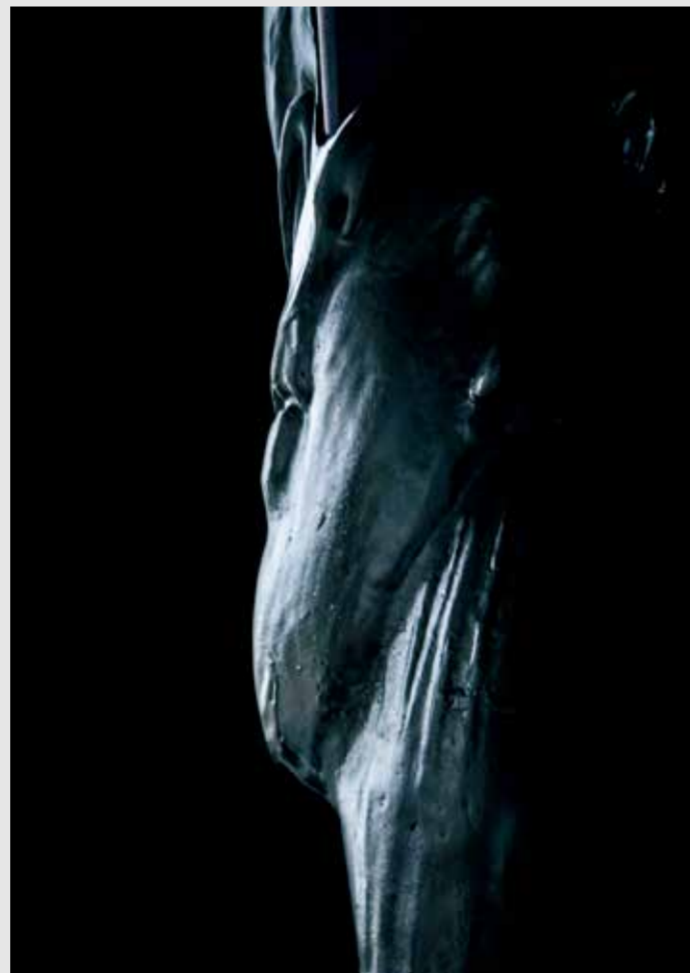
物质与时空对话 III (A Dialogue between Materials and Time III) · 2020 · 铁·钛金属